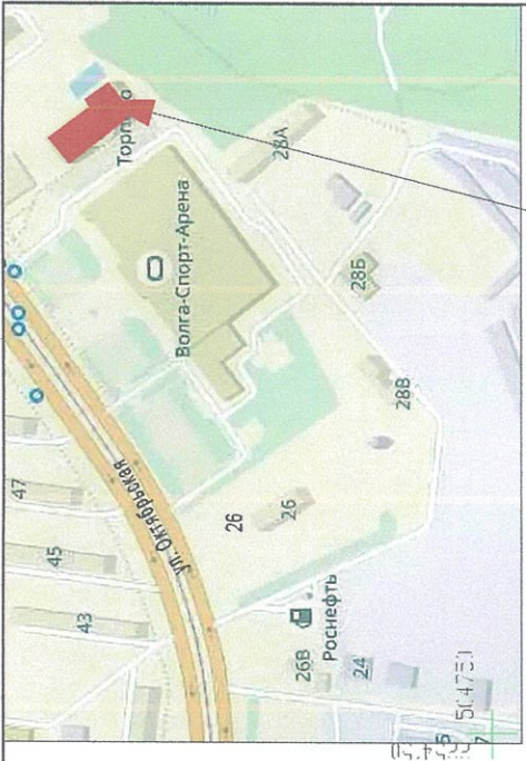
Схема планировочной организации земельного участка с учётом отклонения от предельных параметров разрешённого строительства объектов капитального строительства М 1 : 500